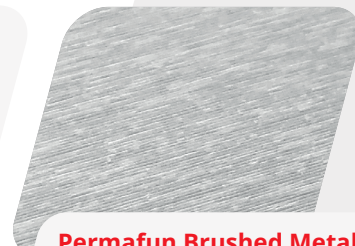
Permafun Brushed Metal