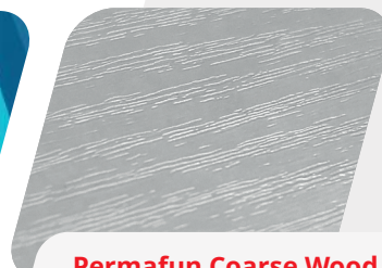
Permafun Coarse Wood